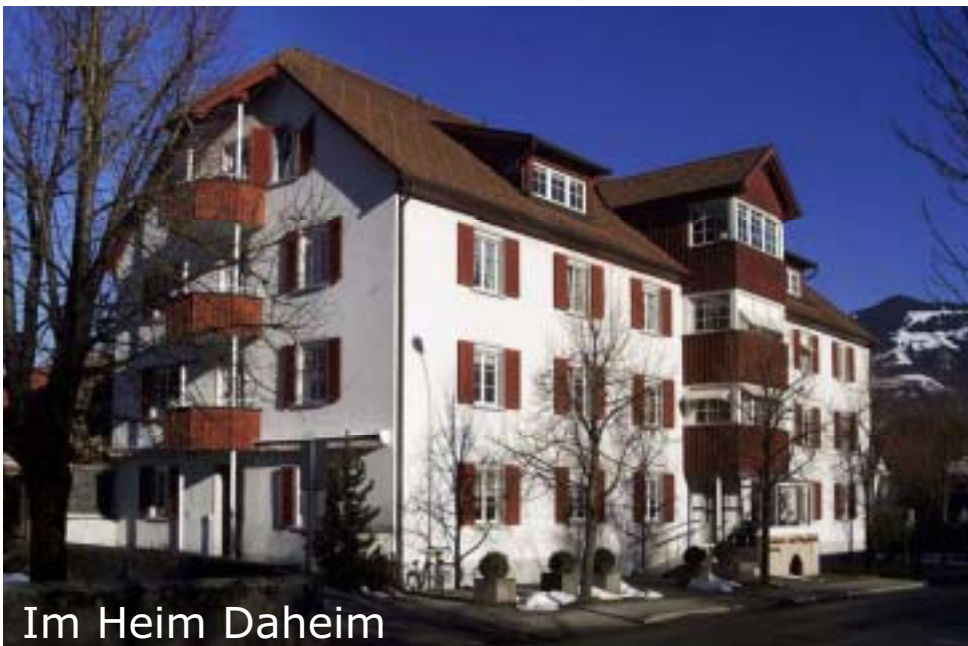
Im Heim Daheim